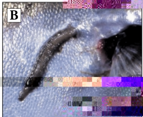
Seriola quinqu radiata