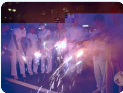
職員と花火を楽しむ患者さん