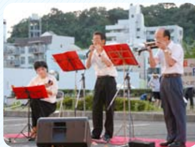
トリオエコーズによる演奏

平成21年8月4日、広島大学病院北駐車場にて病院職員の手づくりによる花火まつりを開催しました。