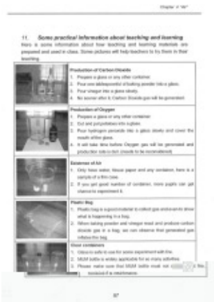
簡易実験操作作成手順