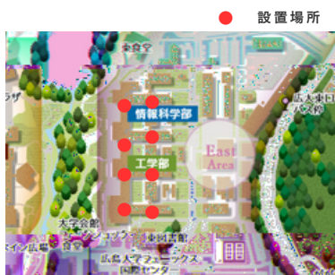
工学部キャンパス