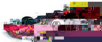
スクーデリア・アルファタウリ・ホンダ F1マシン

p Ô z q Ô ² t o Ú ³ ĩ z ? ^ ( Ú m £ ` • §