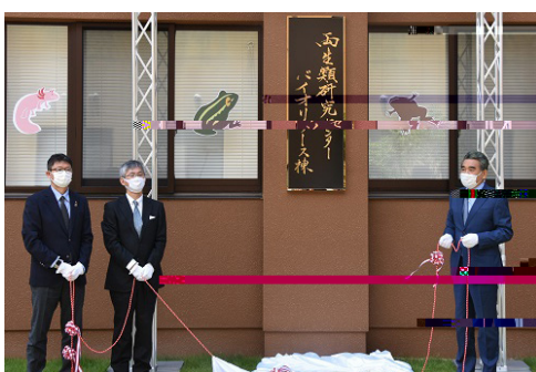
右から越智学長、荻野両生類研究センター長、安倍理事・副学長