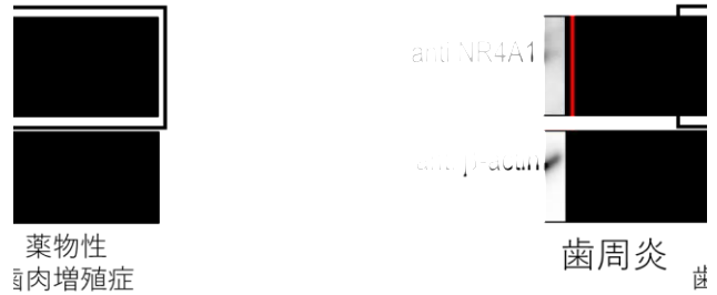
薬物性歯肉増殖症

薬物性歯肉増殖症動物モデルの歯肉組織中のNR4A1の発現が減少していることを確認