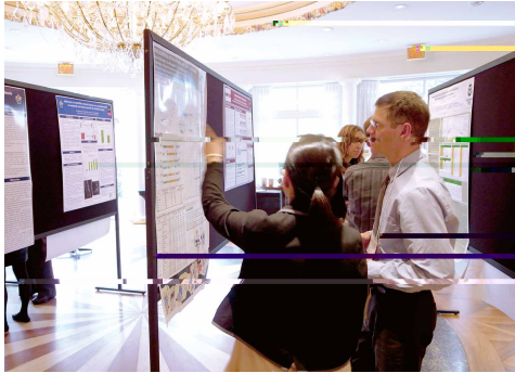
国際ネコレトロウイルス学会での発表の様子