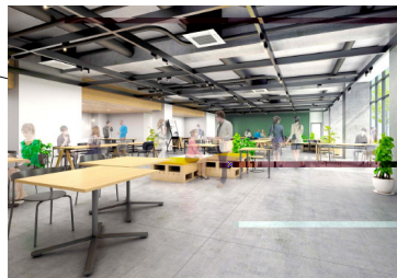
多目的スペース(1階)