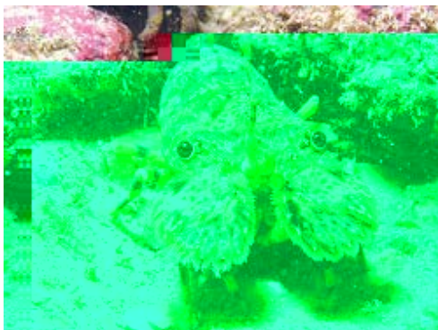
図3．キタンヒメセミアビ（節足動物）

節足動物：イソガニ，イワフジツボ，カメノテ，キタンヒメセミアビ，クルマエビ，ケフサイソガニ，コノハエビ，シロスジフジツボ，ハクセンシオマネキ，ヒメアシハラガニ，ヒライソガニ，フクロムシ類，モエビ類，ヤドカリ類，ヤマトオサガニ，ヨシエビ，ワレカラ類など