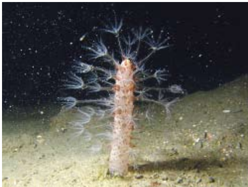
図2．ウミサボテン（腔腸動物）

腔腸動物：アカクラゲ，イソギンチャク類，ウミサボテン，ヒドロクラゲ類，ミズクラゲ，ユウレイクラゲなど