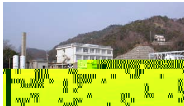
図1．竹原ステーション全景

物生産学部附属水産実験所に改称された。昭和63年（1988）に学部が福山市から東広島市へ移転したが、上記3つの水産実験所は3年後の平成3年（1991）に竹原市の現在地に総合移転した（図1）。平成15年（2003）生物生産学部から生物圏科学研究科への大学院部局化に伴い、農場と共に「生物圏科学研究科附属瀬戸内圏フィールド科学教育研究センター」に改組され、旧水産実験所は「竹原ステーション（水産実験所）」と改称され現在に至る。