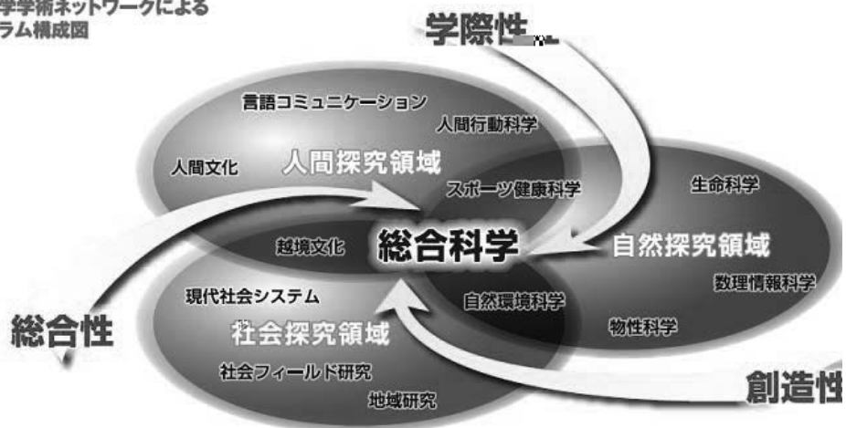
■総合科学学術ネットワークによる プログラム構成図