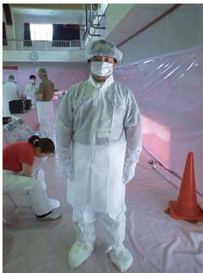
防護服を着用した筆者

立入制限地区に一時帰宅された住民の方々が中継基地に帰ってくる際、放射能に汚染されたチリなどが防護服に付い