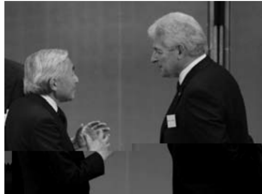
Sordel i i UMS