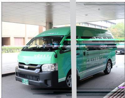
(広島大学循環バス)

今年度からスタートした「広島大学の元気応援プロジェクト」の採択プロジェクトに8件が決定した。各プロジェクトは、学生・教員・地域住民の三者でチームを組んで、地域から提案があった地域課題の解決や地域活性化をめざす。本学からの支援は、助成額は原則30万円まで（最高限度50万円）、採択件数は8件以内となる。 3者の出合いの場となるマッチングイベントを8月に2回開催し、地域から15件の活動テーマを募集した。 採択を受けた事業は、10月から来年2月までの5カ月間活動し、3月にプロジェクト報告会で活動を報告する。 https://www.hiroshima-u.ac.jp/iagcc/ccr/cc2/genki2019 「広島大学公式ウェブサイト」 「地域・産学連携」 「地域連携」 「繋ぐ」 「令和元年度」